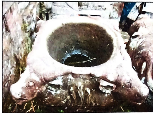
Lesung (Lumpang Batu) Tampak Atas