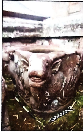
Lesung (Lumpang Batu) Tampak samping